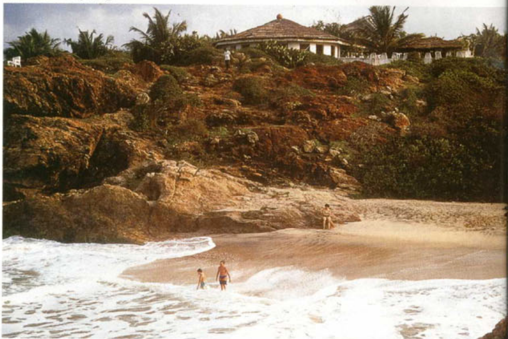
strand van Discovery Village

middag maakt u een verkenningstoer in de directe omgeving, u ontmoet de lokale dorps-Chief en krijgt een welkomstceremonie. (volpension)